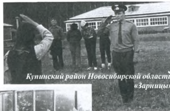
Купинский район Новосибирской области «Зарницы»

На груди у меня Алым пламенем костра Шёлком совести дня Цветёт оранжа, как песня струится. Это юность моя Это радость огня Звук футбольных, хоккейных баталий И туристов тропа, И «Орлёнка» судьба, Цепь родных мне традиций, Эхо дальней «Зарницы» Всё летит над землей В счастье непокорной головой, Синею птицей!