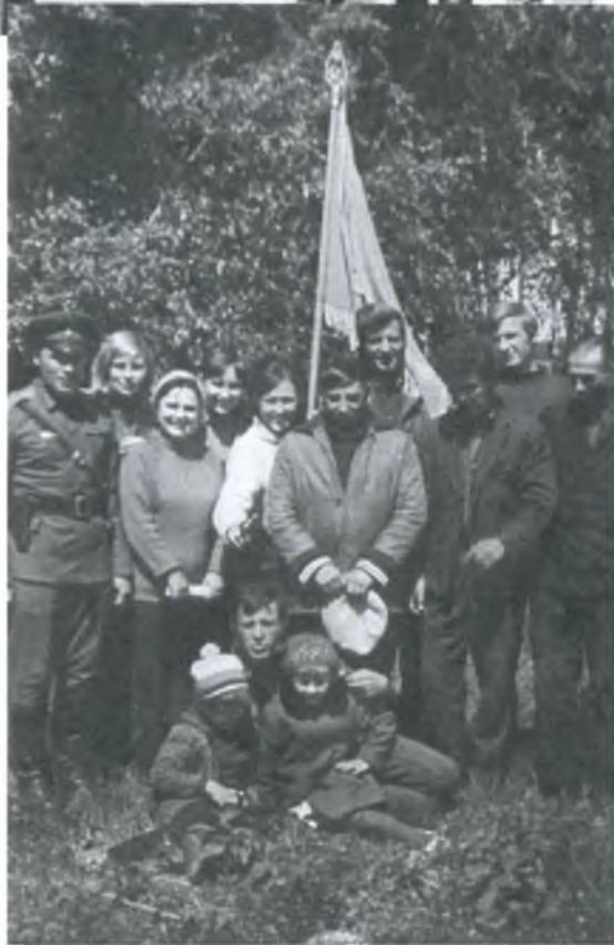
Купинский район Новосибирской области Штаб «Зарницы»