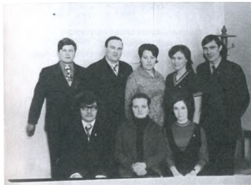
Работники Купинского РК ВЛКСМ Новосибирской области

Принимать решение – это ж блиц – опрос Это, как в мгновение Отогнуть сто ос. Это, как в сражении, Отряд особого назначения Так уж повелось: Отметать суждения Иметь и свое мнение, Чтоб дело удалось.