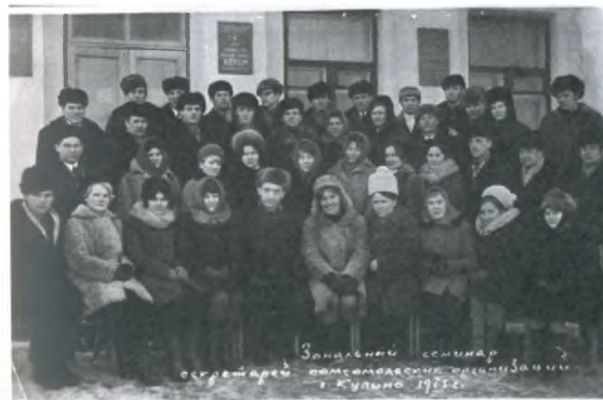
Зональный семинар секретарей комсомольских организаций г. Кульма 1956.