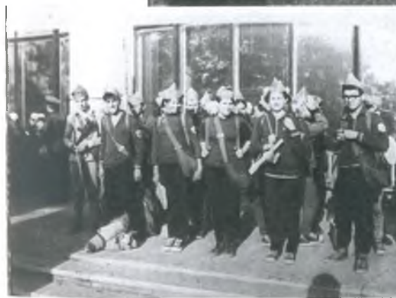
Участники областных соревнований