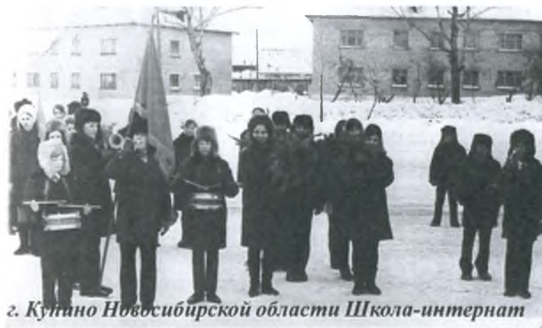
г. Кунино Новосибирской области Школа-интернат

За кадром остаются все дела, Которые не требуют рекламы, За кадром: там всегда война За мир, за правду, честь И за дела большой игры В могучей панораме.