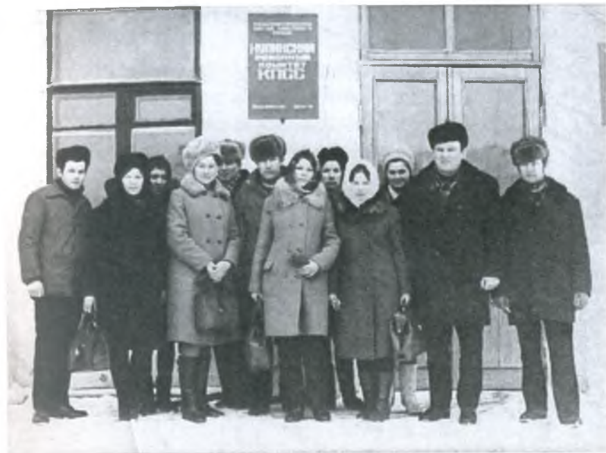
г. Купино Новосибирской области

Туч небесные постели И геологов тропа. Цвет душистого горошка, Запах пыли, поле ржи, На Урале столб межи И раздолье на Байкале. В травах жёлтые ужи. Стук станков и гул колес, Лент дороги у берёз, Звук метро и звук трамваев... «Сниться те, що вси мы маем», А ещё, душа – столица, Снятся мне людей всех лица, Что живут в Москве, Баку, И в Иркутске, на Урале, И в районах Забайкалья, И в Берлине, в Казахстане, В Киеве и Кутаиси, И в Белграде, и в Париже: Всех их помню, всех их вижу... Может быть, друзья не надо Строить вновь границ громады, Может будет, будет пусть! Общий наш – Земной Союз?!