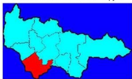
Кондинский район на карте Ханты-Мансийского Автономного округа