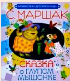
«Сказка о глупом мышонке»